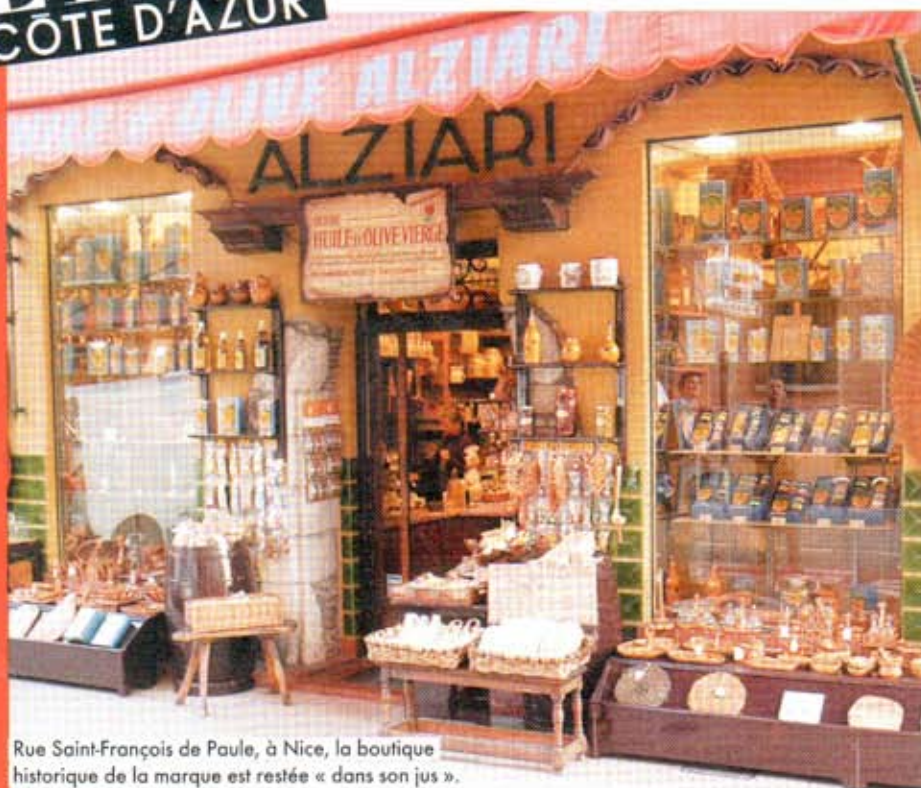
Rue Saint-François de Paule, à Nice, la boutique historique de la marque est restée « dans son jus ».