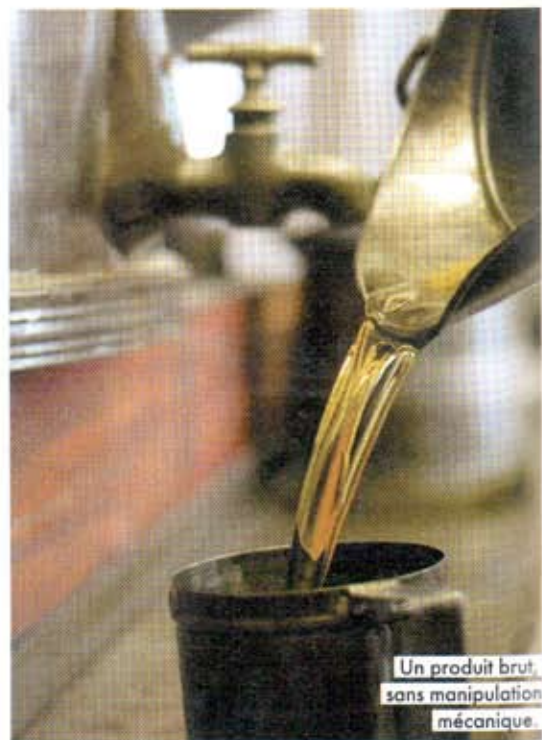
Un produit brut, sans manipulation mécanique.

Car si les produits Alziari voyagent (ils sont distribués à New York, Londres, Berlin ou Tokyo), les deux boutiques, rue Saint-François de Paule et boulevard de la Madeleine, sont demeurées « en l'état », avec meubles d'époque, commodes de la famille et doux parfums d'herbes de Provence. Un fouillis organisé, qui traverse les années sans prendre une ride. « Les habitants du Vieux-Nice, qui venaient