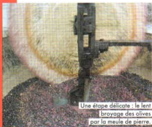
Une étape délicate : le lent broyage des olives par la meule de pierre.