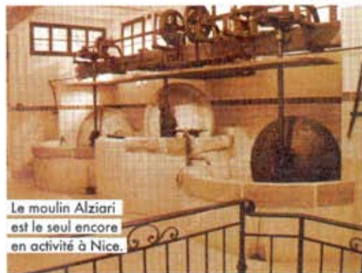
Le moulin Alziari est le seul encore en activité à Nice.

C'est toujours de manière traditionnelle, à la génoise, que le moulin fabrique son huile d'olive. Les fruits sont lentement broyés par une grande meule de pierre, dans une cuve, elle aussi en pierre. Cette opération dure deux à trois heures : rien ne sert de se presser, les olives apprécient la douceur. Le bassin est ensuite rempli d'eau froide. L'huile d'olive remontant à la surface est récupérée. Le reste de la pulpe sera disposé dans des scourtins (bérêts en fibre de coco) pour y être pressé. Au final, aucune manipulation mécanique pour un produit brut, au goût à tomber.